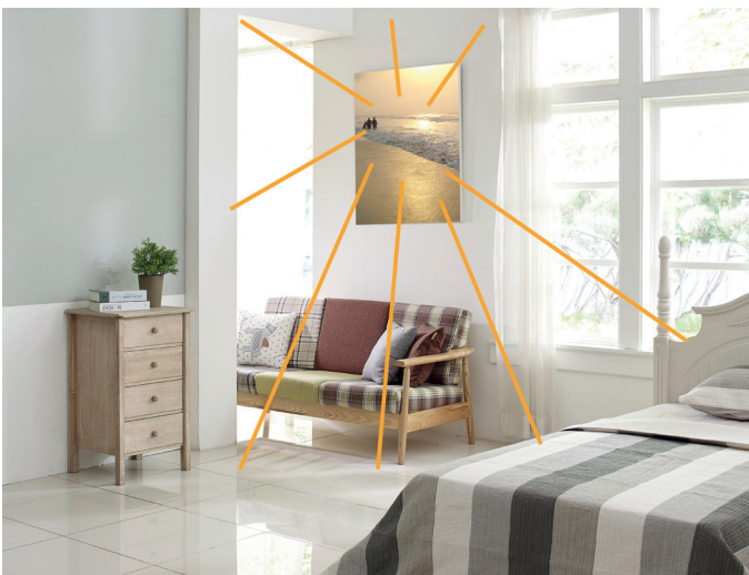
Możliwość naniesienia obrazu / zdjęcia (również w kolorze) na panel promiennika daje pole do popisu dla architektów wnętrz